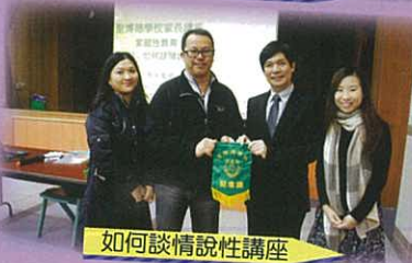
如何談情說性講座