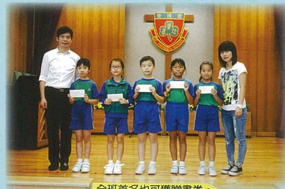
全班首名也可獲贈書券。