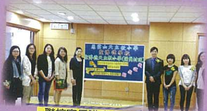
聯校家長講座合照