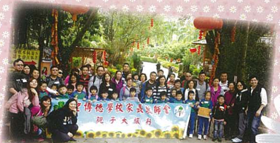
家教會親子大旅行合照

1. 家教會親子大旅行 2015年3月8日 (星期日) 師生家長共有420人出席 地點：甜心餅廠、敬輝農莊、大棠荔枝山莊自助燒烤