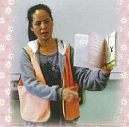
故事姨姨講的故事真動聽!