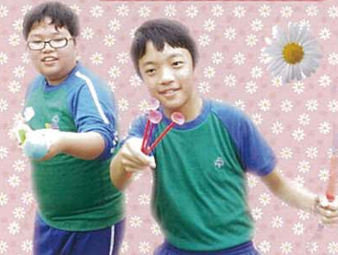
同學們也樂在其中!