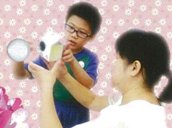
親子齊合作，凡事可達成。