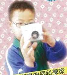
我們齊齊做個科學家。