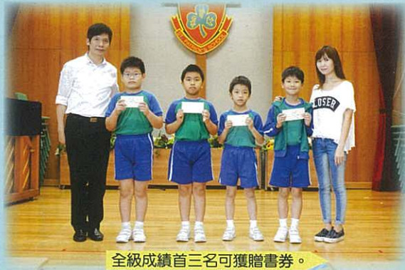
全級成績前三名可獲贈書券。