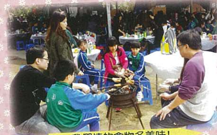
我們燒的食物多美味!