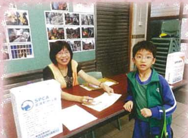
家長義工主持理財攤位遊戲