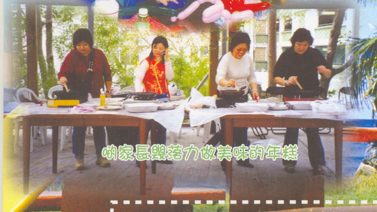
啲家長幾努力做美味的年糕