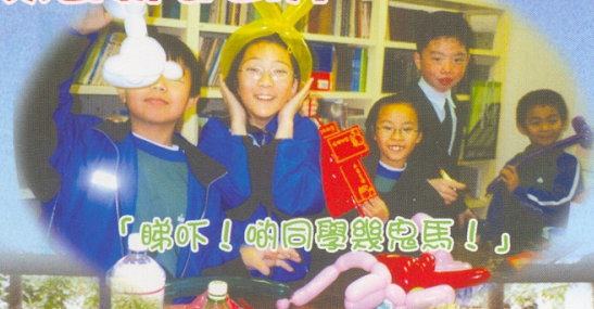
「睇吓！啲同學幾鬼馬！」