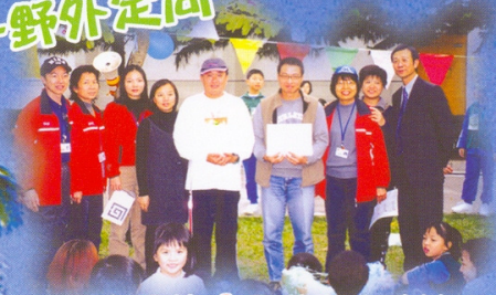
最大得益「團隊合作精神！」