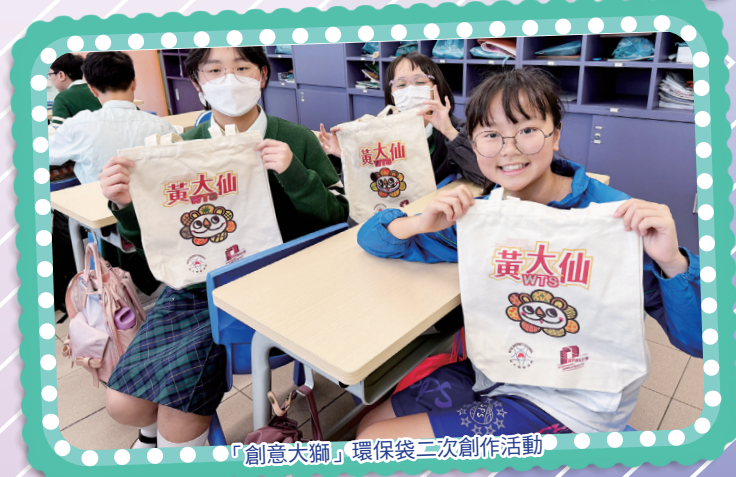
「創意大獅」環保袋二次創作活動