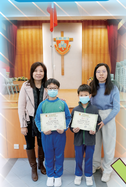
本年度「整潔之星」及「禮貌之星」