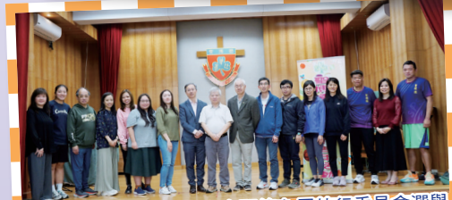
2024校友會周年會員大會暨第七屆執行委員會選舉