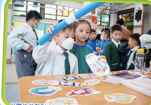
以攤位遊戲形式，讓同學學習覺察自己的情緒和壓力來源及壓力反應，認識如何面對和處理壓力。