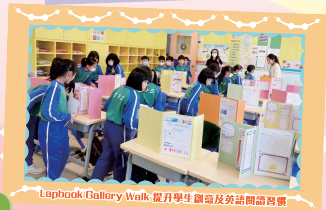
Lapbook Gallery Walk 提升學生創意及英語閱讀習慣