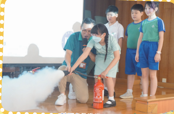
社區急救準備講座