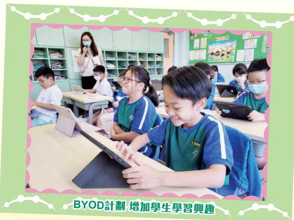
BYOD計劃 增加學生學習興趣