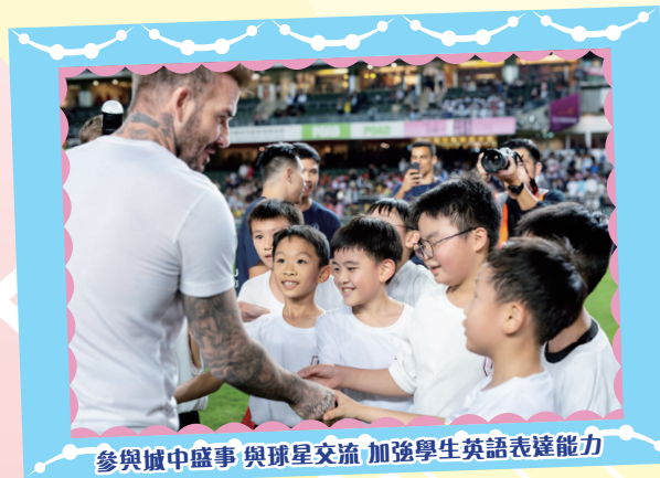
參與城中盛事 與球星交流 加強學生英語表達能力