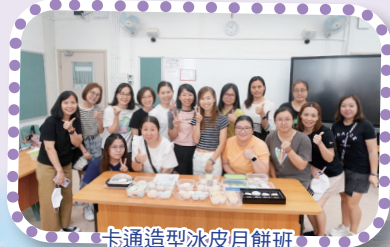
卡通造型冰皮月餅班