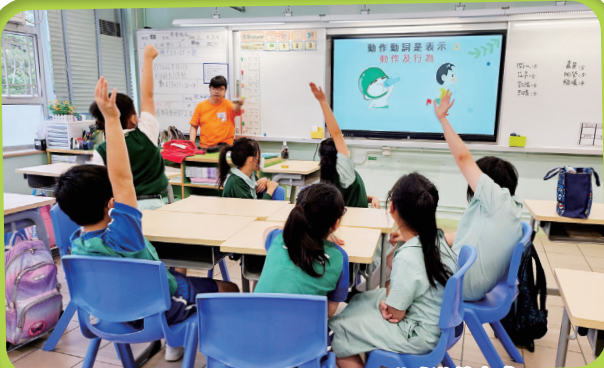
「樂在讀寫訓練小組」：利用活動或遊戲方式學習中文，以提升學生的學習興趣及動機。