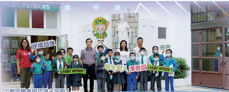
公教同學參與認識主保聖人 聖博德及學校校訓活動