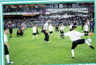
足球隊在大球場與球星切磋球技