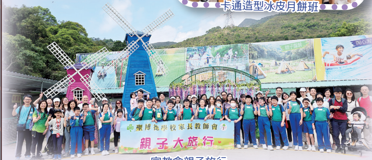
聖博德學校家長教師會 親子大旅行 家教會親子旅行