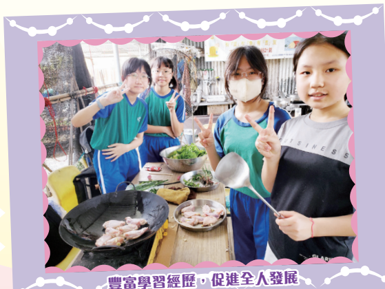
豐富學習經歷，促進全人發展