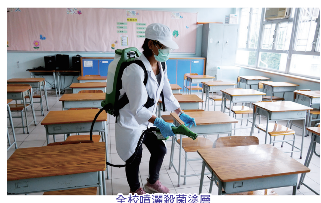
全校噴灑殺菌塗層

校舍於復課前進行全面清潔，包括：禮堂、操場、課室、圖書館、特別室、會議室、走廊、梯間及洗手間等。清潔範圍包括清潔所有桌、椅、電腦（包括平板電腦）、電話、地板、洗手盆、門把手、電燈開關掣等。