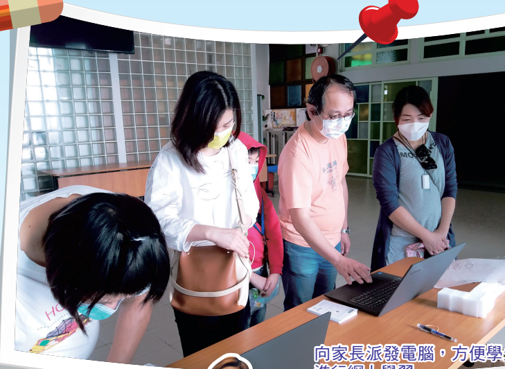
向家長派發電腦，方便學生進行網上學習