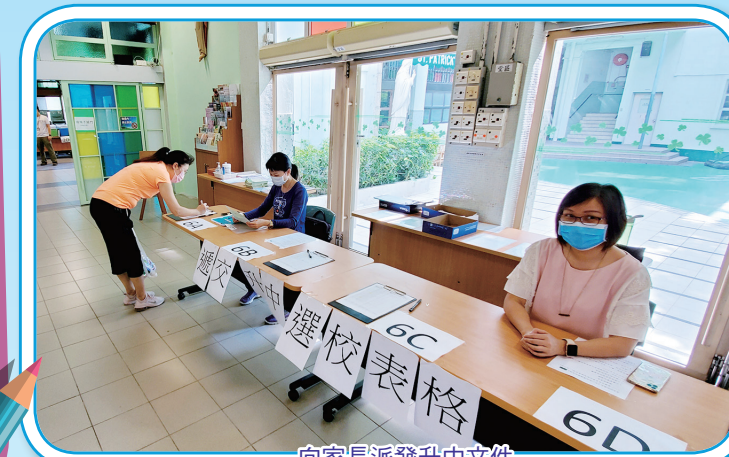
向家長派發升中文件