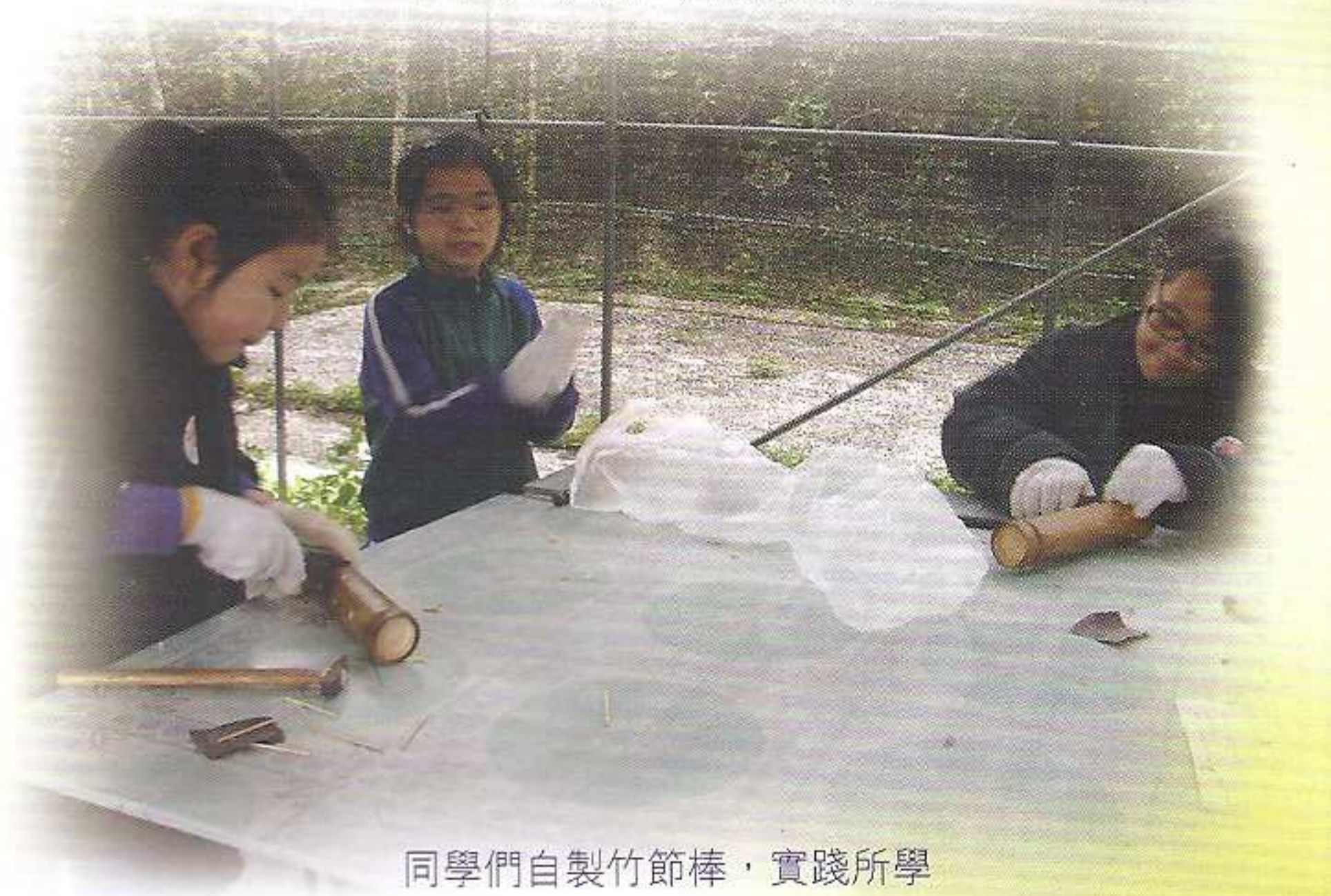
同學們自製竹節棒，實踐所學