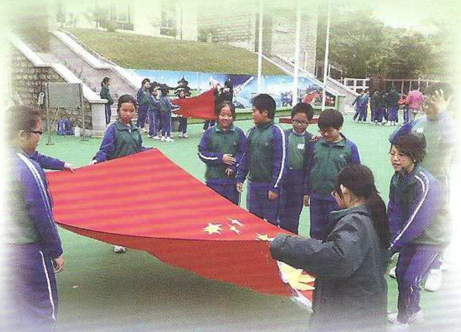
看!我們收起國旗沒難度!