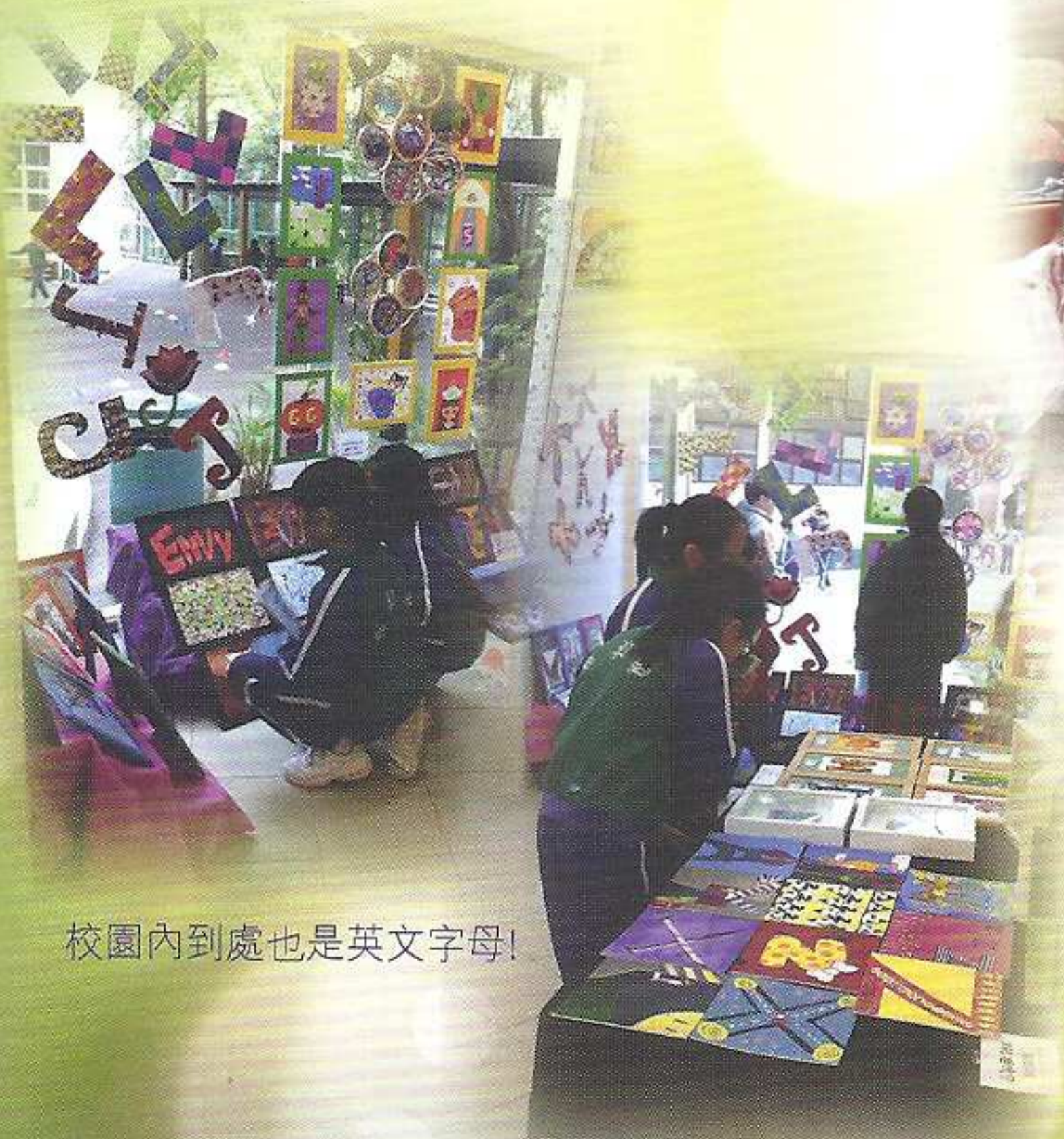
校園內到處也是英文字母!

為促進學校之間的藝術交流，本校與十一間中小學攜手舉辦聯校視覺藝術巡迴展。各校學生以英文字母(A-Z)為創作主題，運用不同物料設計英文字母，而本校的創作題目為「字母大變身」，作品在各校間進行巡迴展覽，藉此增加學生作品參與展覽的機會，以達到藝術交流的目的。