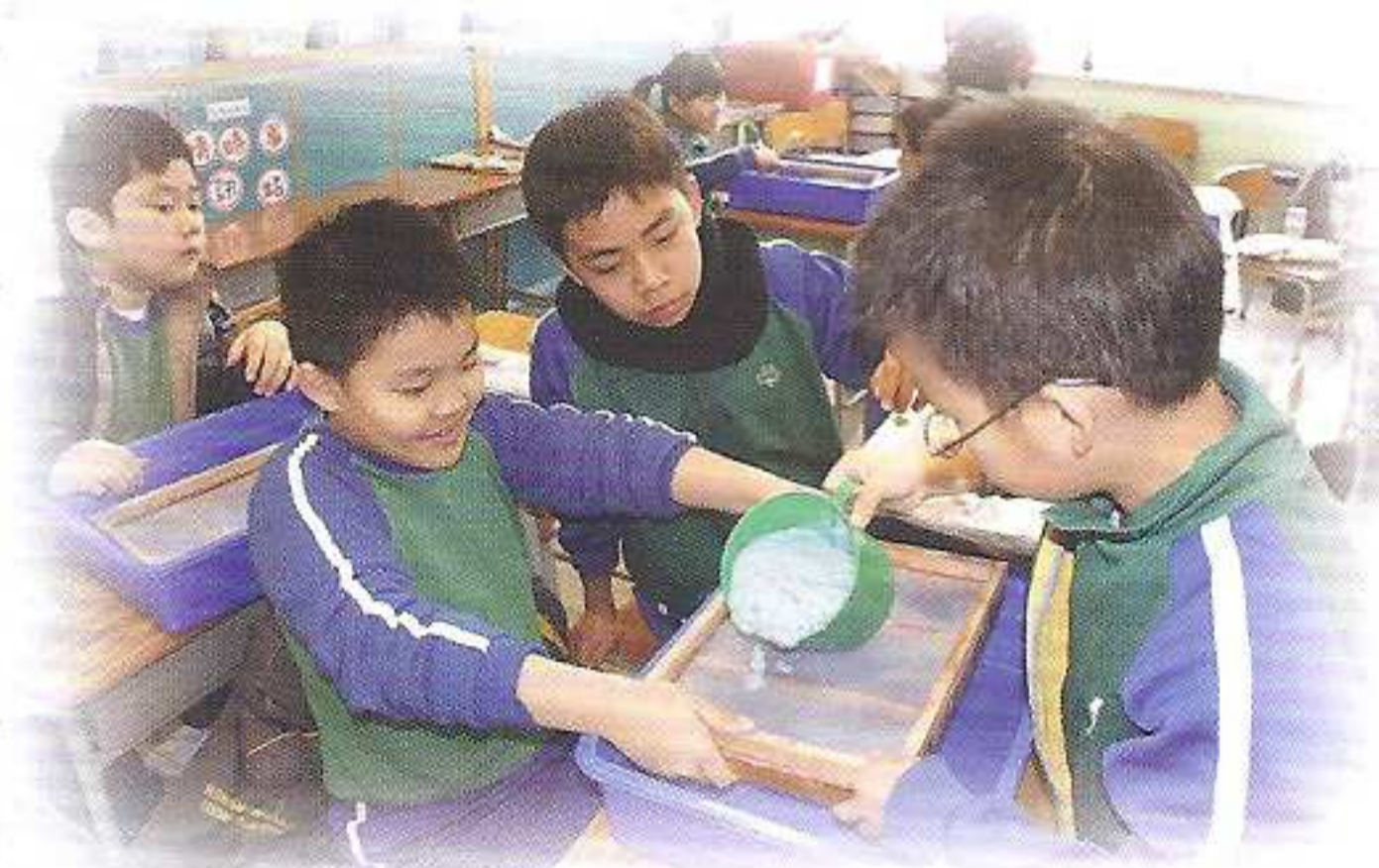
同學親手製作環保紙

為加強同學認識與別人相處的態度，從而建立和諧共處的關愛文化，本校於12月10日舉行嘉年華，主題是「全心傳意顯情真 愛己愛人樂身心」。當天共有十二個配合主題的攤位，當中包括任澤民神父及高明校長一起在「中華閣」即席揮毫，留下「愛」的墨寶。此外，在「愛心聖誕樹」攤位內，同學要把愛德行為咭掛在聖誕樹上，學習耶穌包容的愛；而在「救救地球我做到」攤位學習利用環保物料製作紙飛機及再造紙，實踐環保愛地球的行動；還有學生親手創作環保樂器的「愛·樂器」，然後前往「節奏繽紛樂」攤位用自製樂器演奏樂曲，最後在「關愛加油站」內演唱，利用歌聲及勉語把愛人如己的精神傳揚開去。