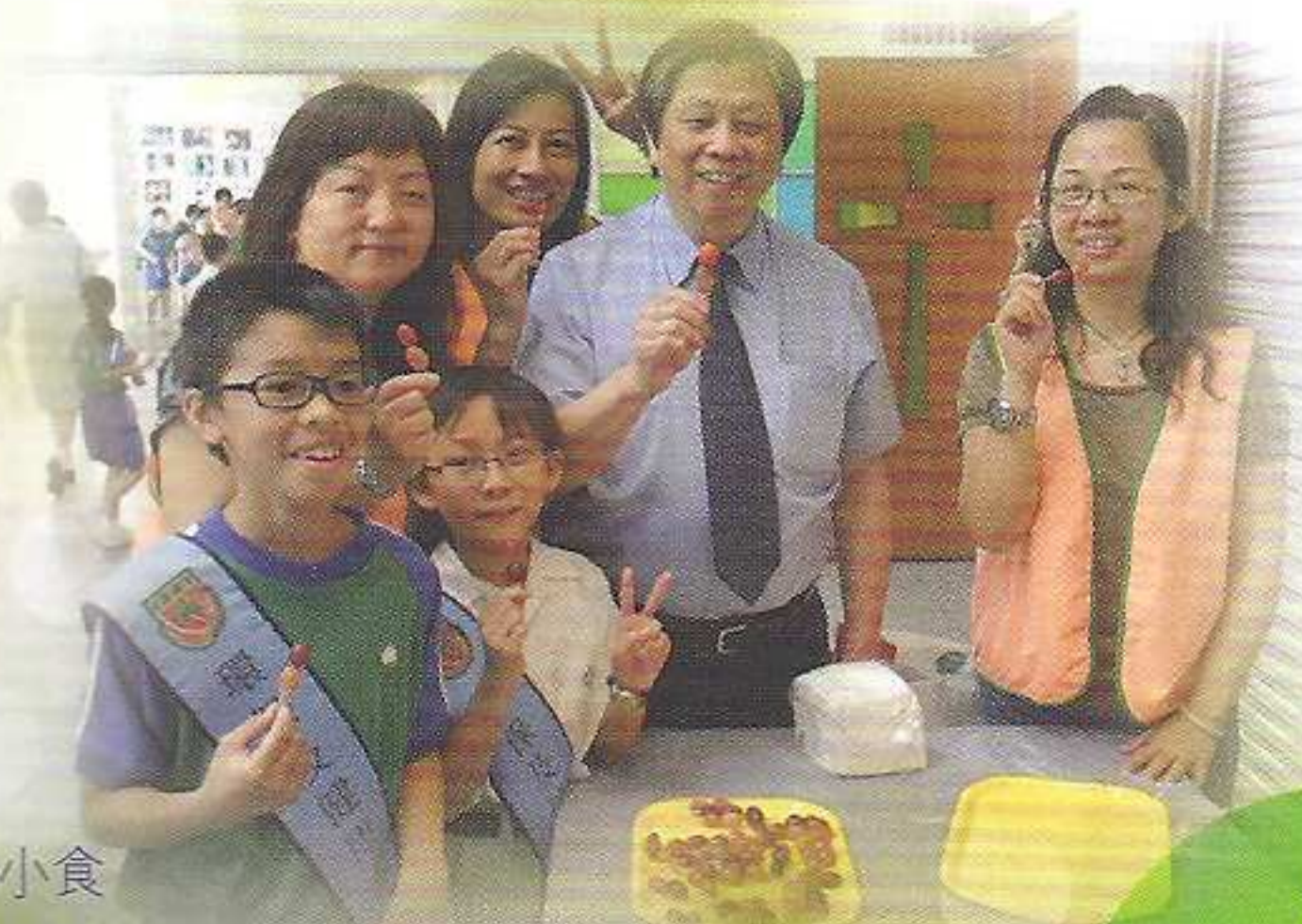
校長與我們一起吃有營小食

為建立健康校園，本年度的健康校園專責小組中加入家長委員，向同學推廣「有營小食」，從而培養學生健康飲食的良好生活習慣。