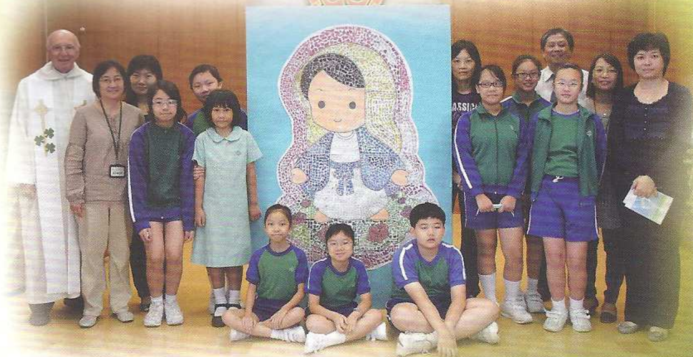
同學們細心製作的聖母像