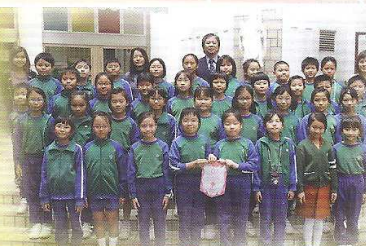
同學在三、四年級粵語集誦比賽中勇奪冠軍