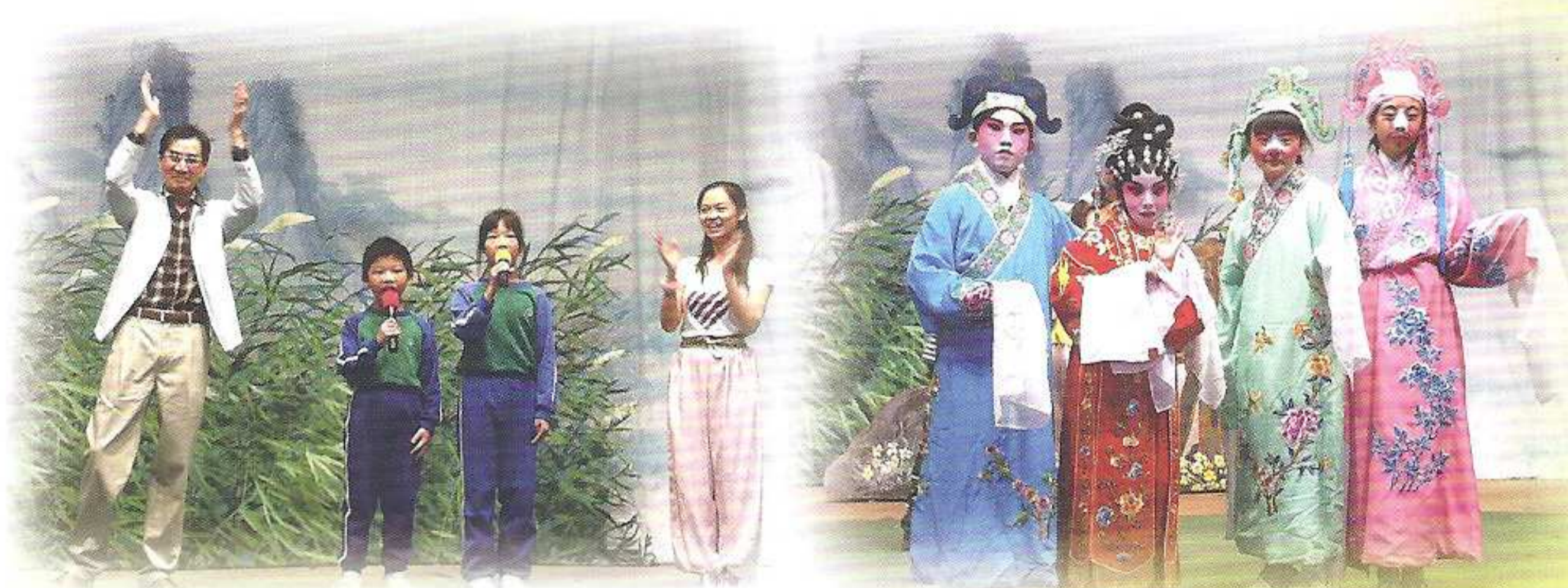
4D班陳若好及2C班陳麒匡同學與粵劇名伶新劍郎先生同台演唱