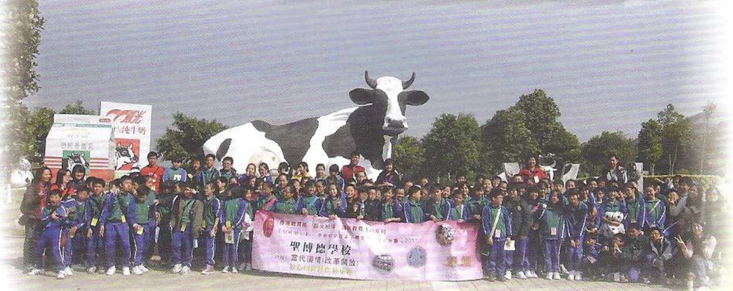
六年級同學遠赴深圳光明農場，認識「綠色食品」的生產過程