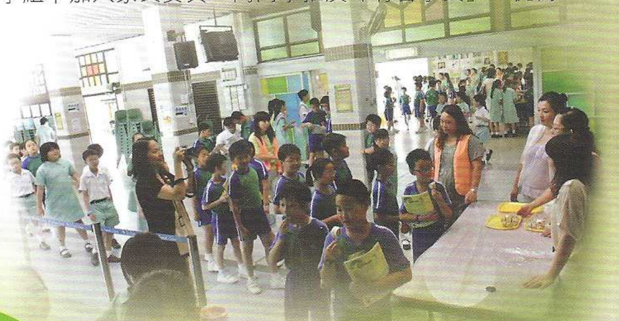
小食檔前大排長龍