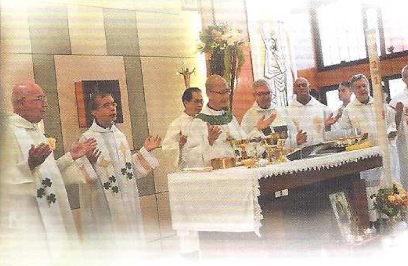
湯漢樞機和多位神父為堂區主保瞻禮共祭