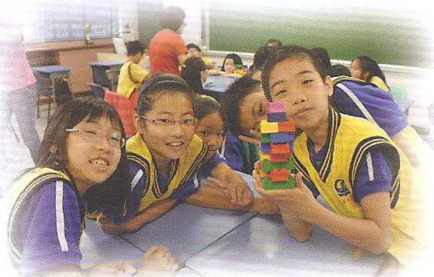
基督小先鋒透過活動來學習

本校設「小腳印班」、「基督小先鋒」及「福傳大使」，透過不同活動，包括聖經分享、故事講述、歌詠、角色扮演、製作手工及遊戲等，讓學生認識及信賴上主，效法基督，擁有一顆仁愛的心。