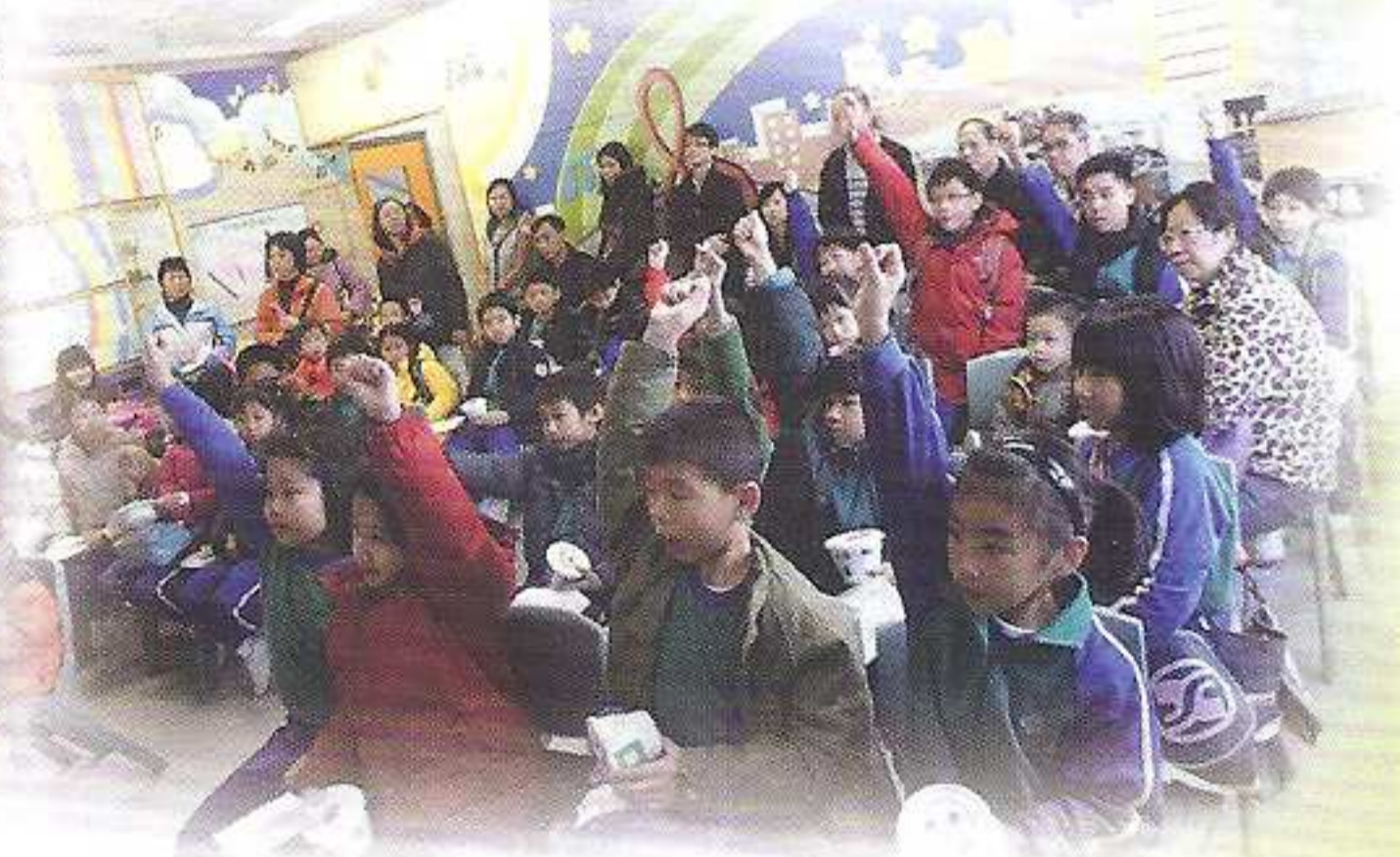
嘉年華的氣氛多熱鬧