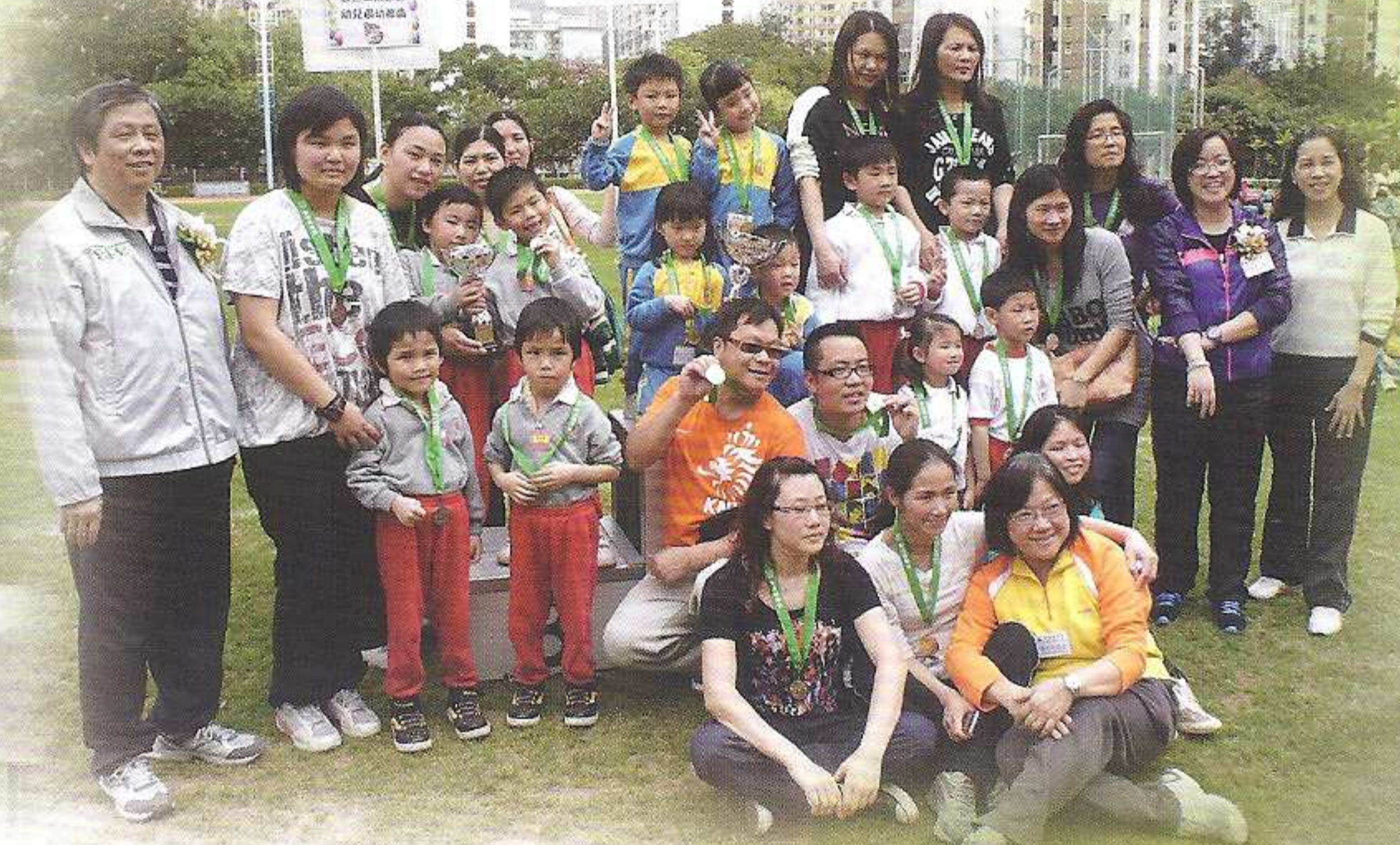
幼稚園同學竭盡全力，爭取佳績