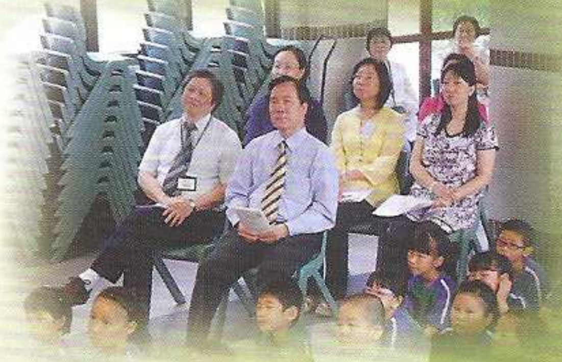
三位天主教小學的輔訓老師一起參與禮儀