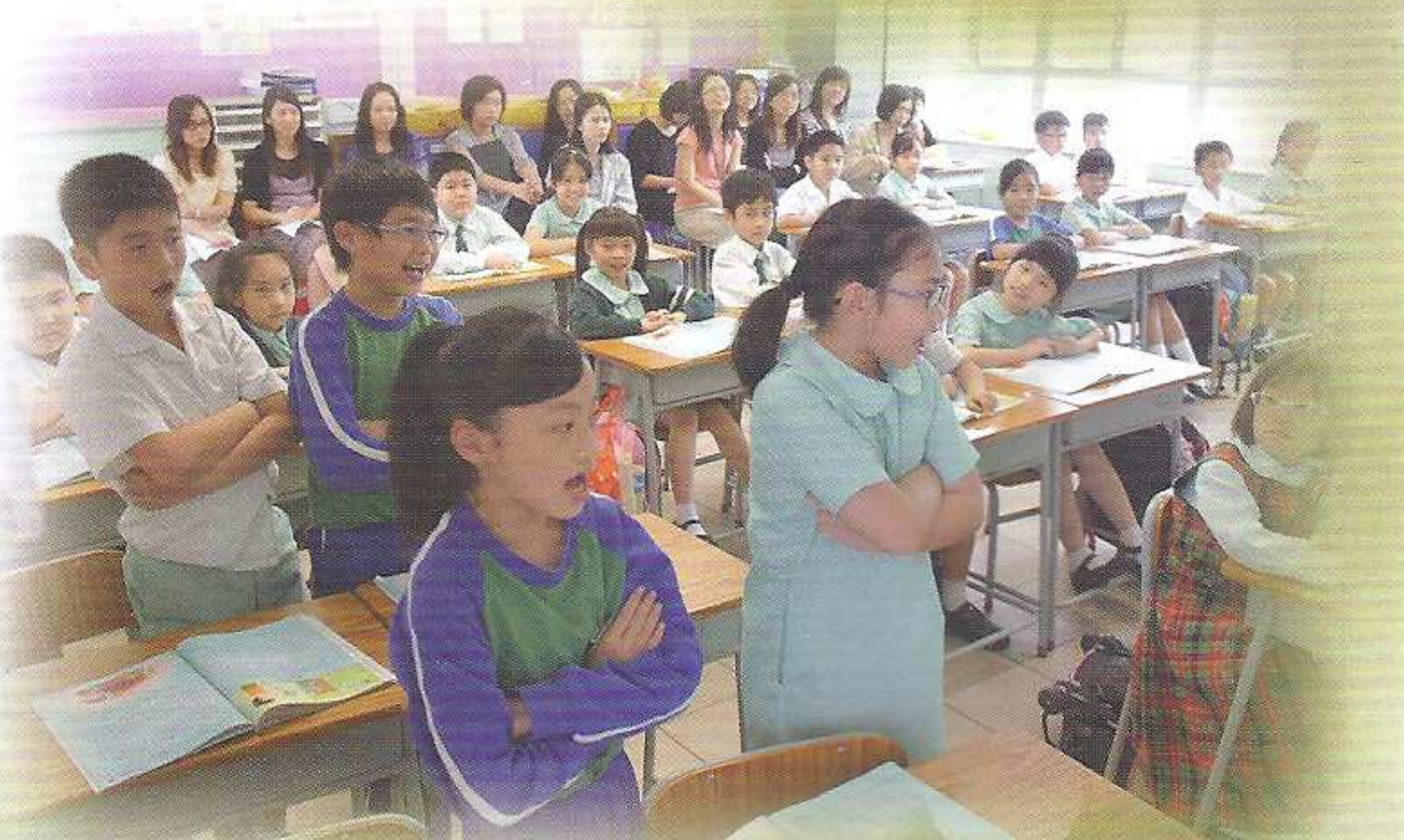
教師欣賞同學朗讀課文時配合相關的動作