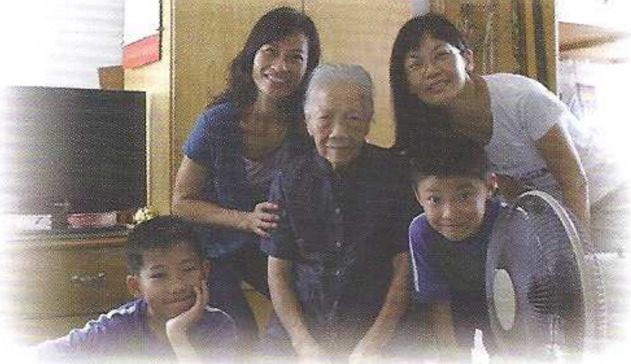
老師、家長、學生與長者共聚一堂

本校於中秋節期間探訪本區長者，並邀請他們參與堂區於9月25日舉行的「愛心樂聚聖博德」的活動。同學透過活動，為長者送上歡笑和溫暖，實踐耶穌基督愛主愛人，盡己責任，服務他人的精神。