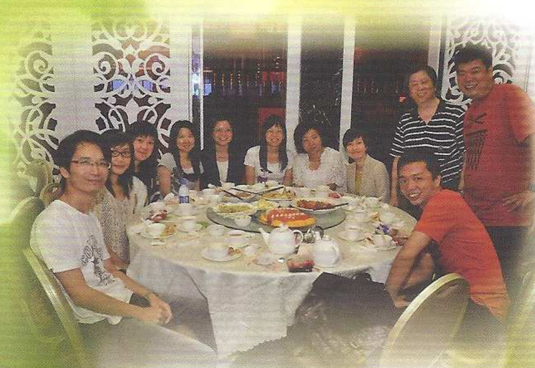
我們在任神父生日會上開懷大嚼