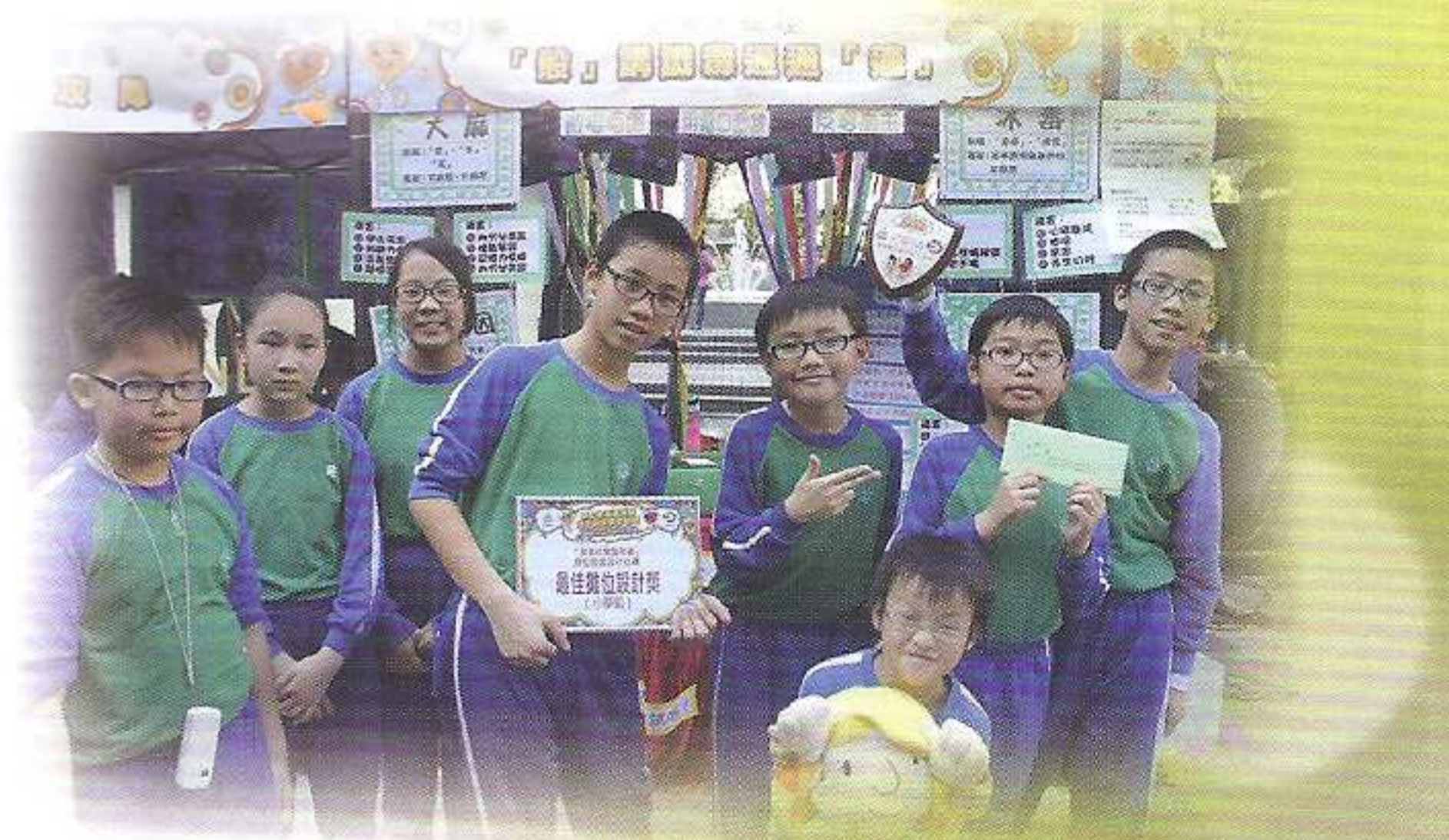
我校獲得全場最佳攤位設計獎，YEAH!

香港天主教教區學校聯會與香港警務處毒品調查科於2012年3月18日，在中環遮打道行人專用區舉行「無毒校園嘉年華」。當日活動包括攤位遊戲、禁毒展覽和學校及社區團體表演。本校師生設計的攤位遊戲，既有創意，也能配合大會主題，故獲得「最佳攤位設計獎」。