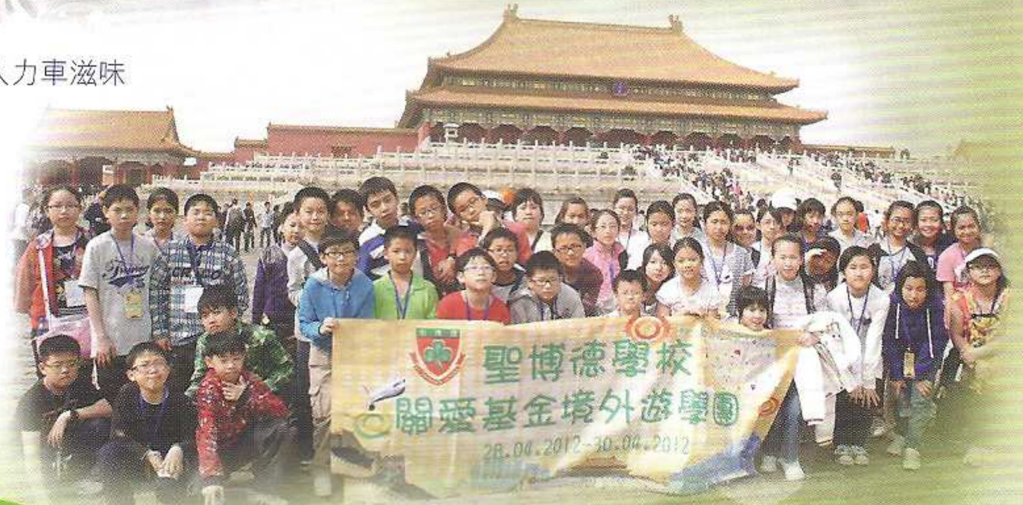
我們在故宮前留倩影