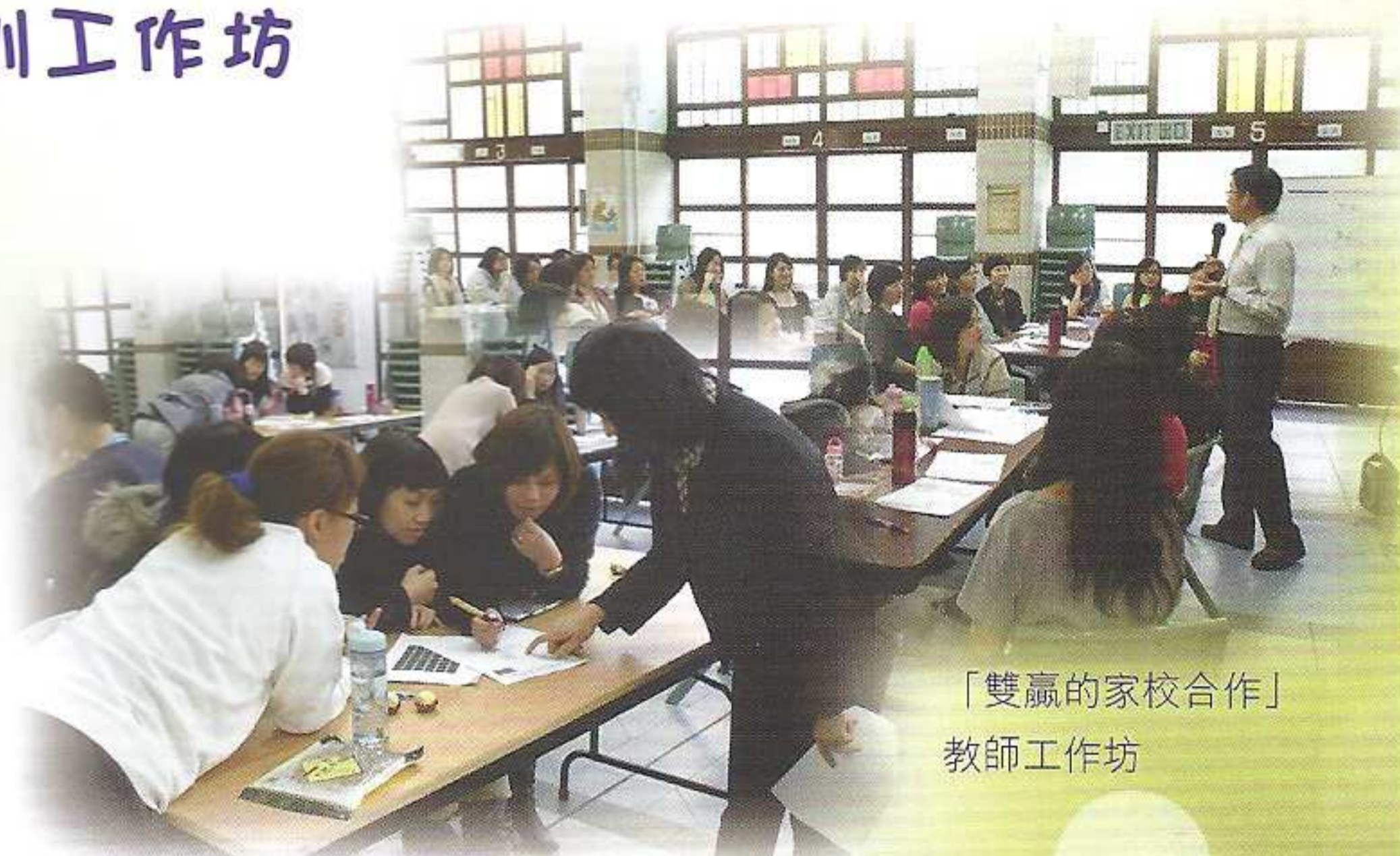
「雙贏的家校合作」 教師工作坊