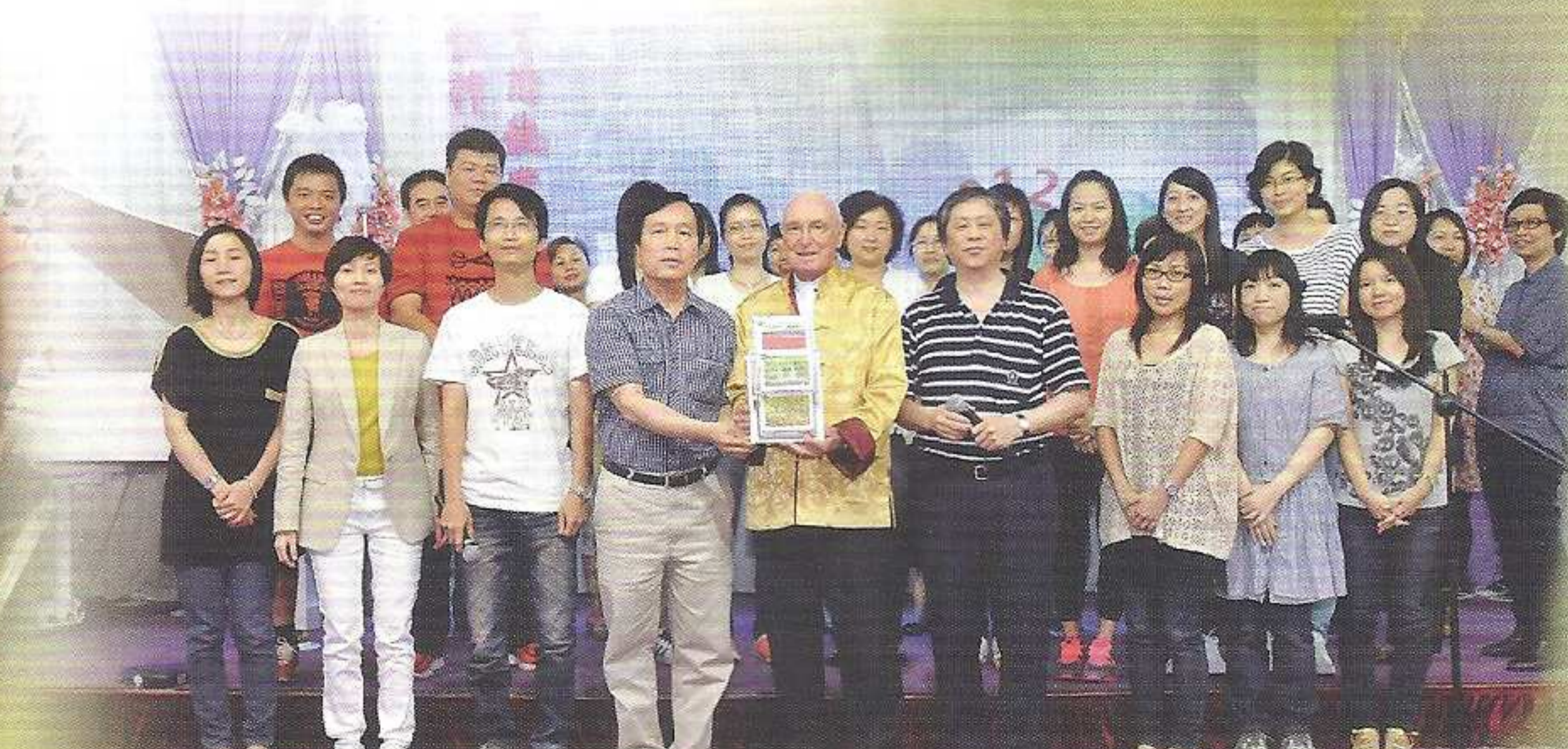
親手製作的相架，載着全校老師的相片和祝福語