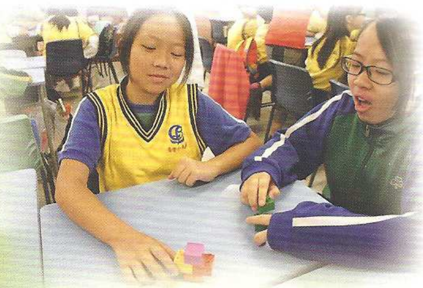
運用天主恩賜的智慧來解難

本年度活動的主題是「天生我才必有用」，學生透過團體集會，強化會員的身份認同，並燃點他們的福傳心火。