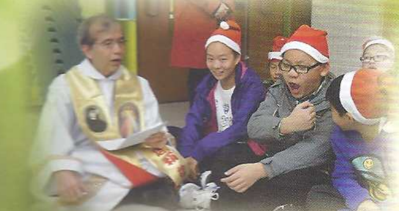
神父透過尼瑪奴耳的故事來講解天主與我們同在