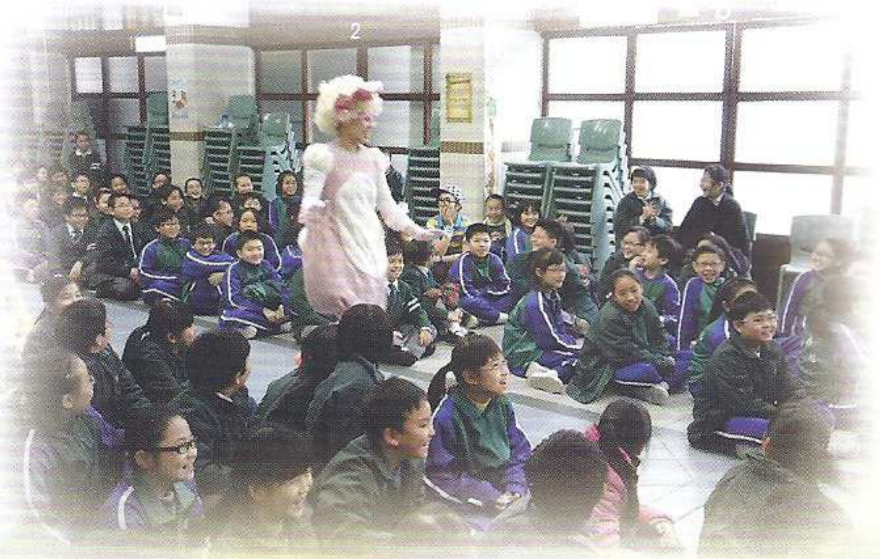
香港話劇團精彩的演出，令同學加深認識減廢回收的知識