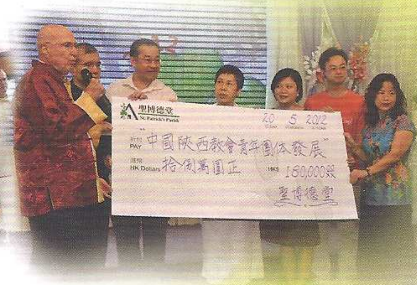
步行籌款共籌得十八萬