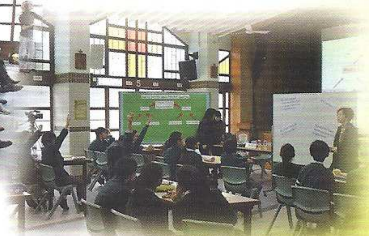
同學們積極投入英文科的課堂學習