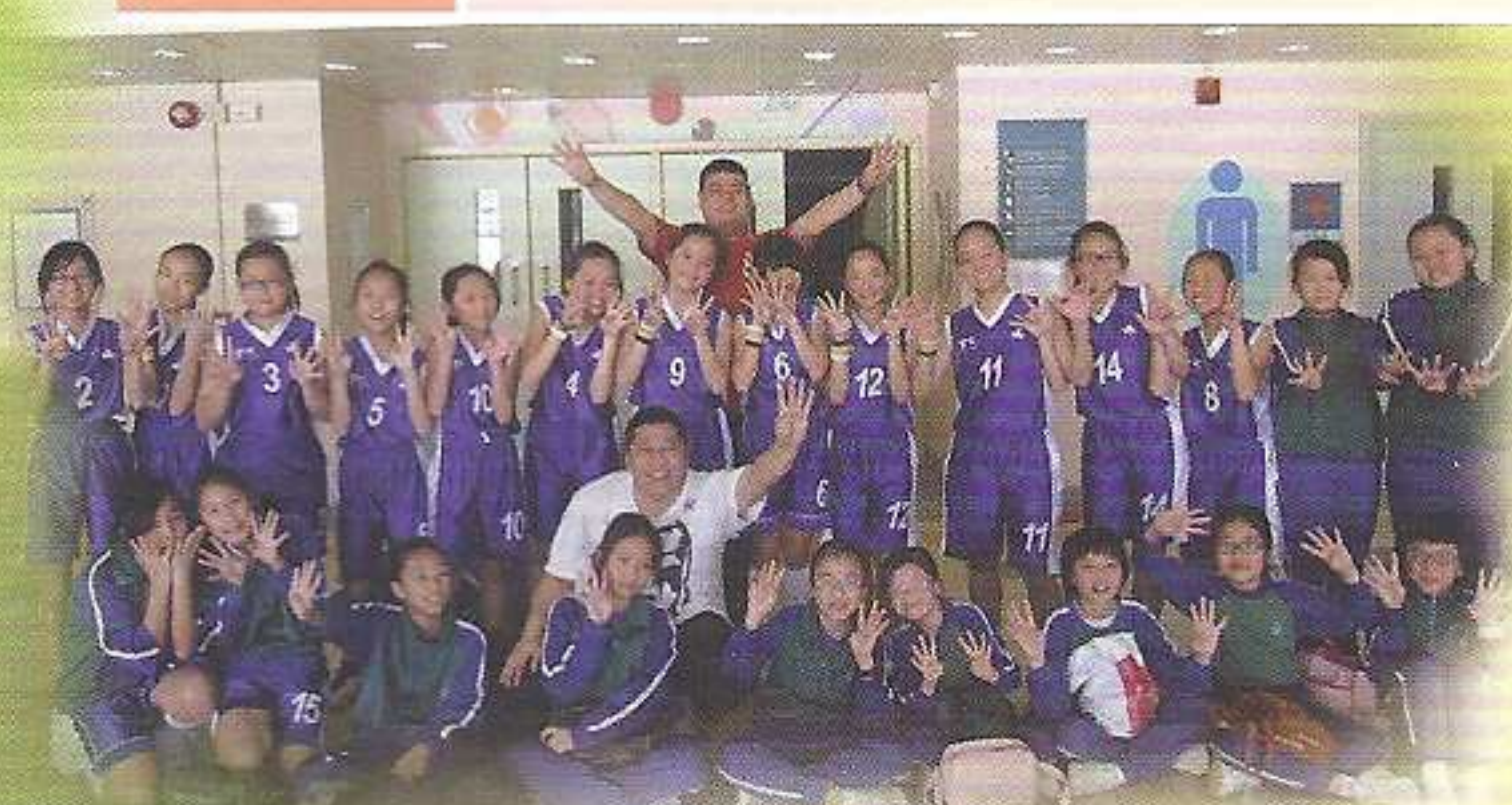
女子籃球隊連續四年在九龍北區籃球比賽中奪冠