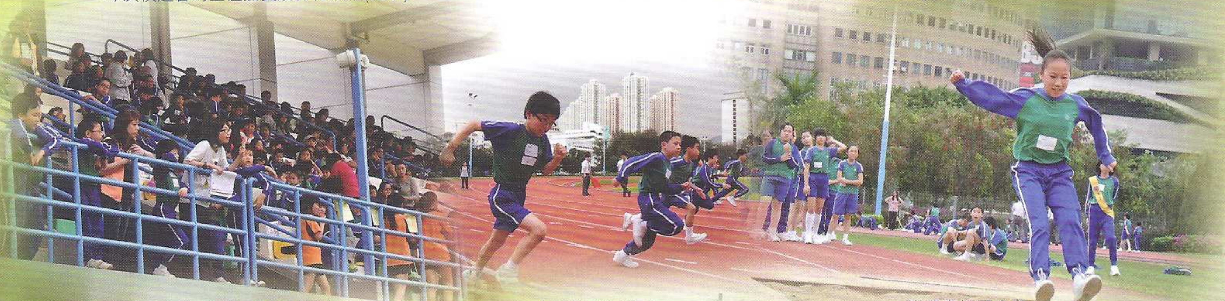
全體同學在看台上吶喊打氣