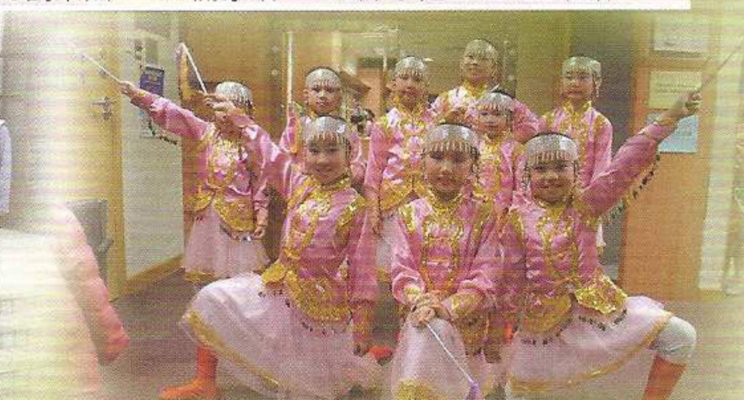
舞蹈組同學以優美的舞姿贏取獎項