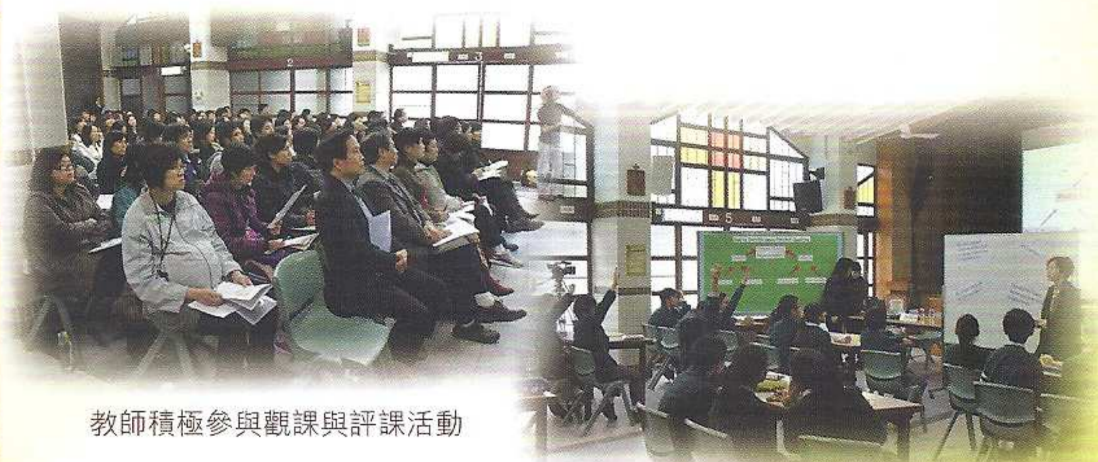
教師積極參與觀課與評課活動