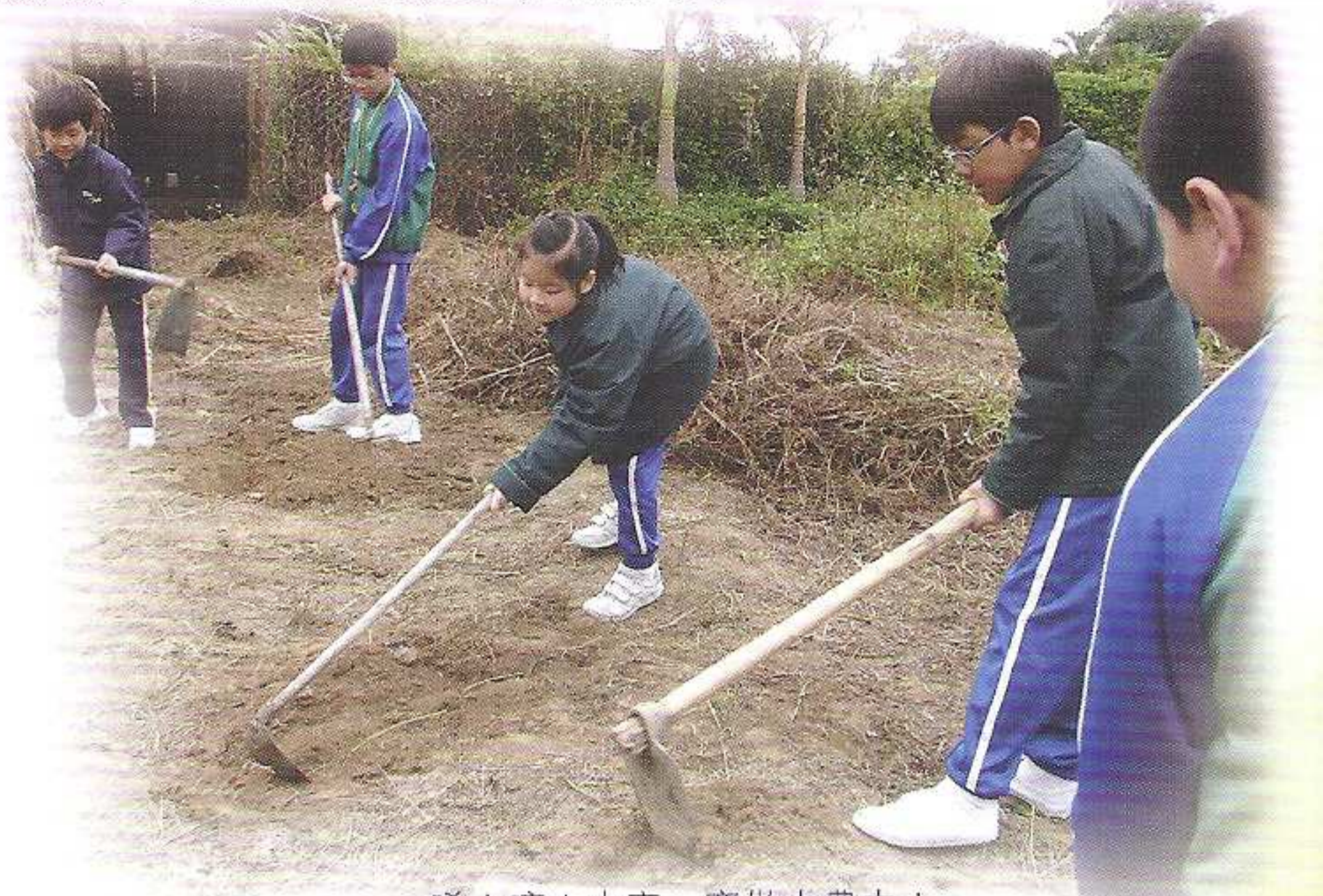
唏！喲！大家一齊做小農夫！

公益少年團於2012年3月10日參加「田園體驗日」，讓學生體驗農務生活。學生在竹藝工作坊以自然物料製作樂器或用具，從活動中欣賞大自然之美。