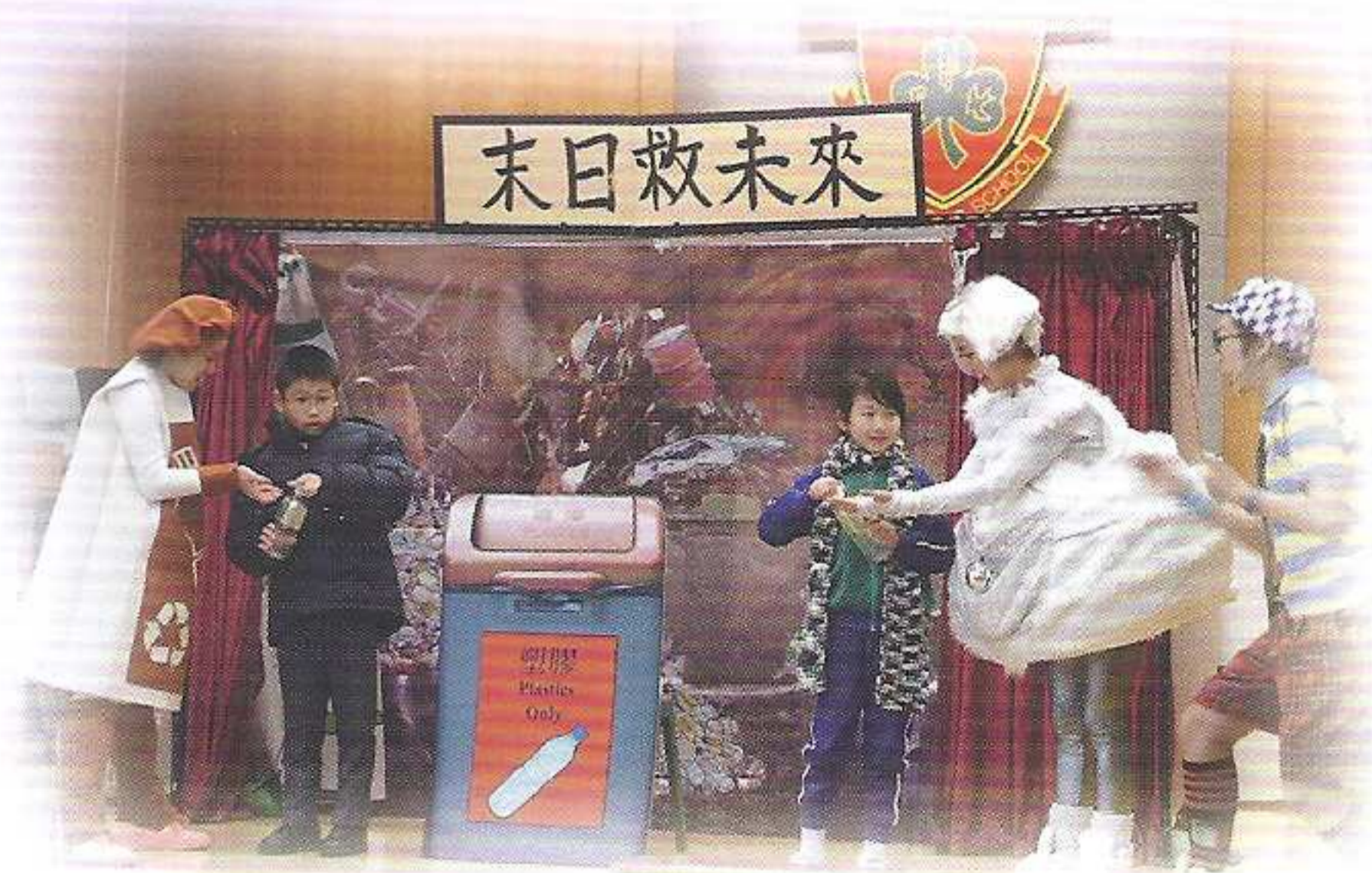
兩位同學上台參與互動劇場

為提高學生對減廢回收的認識，於2012年2月29日安排四、五年級學生欣賞「減廢回收在校園 塑膠再生變資源」的互動劇場。當日香港話劇團成員透過話劇教導學生如何減廢及盡量回收有用的廢物。