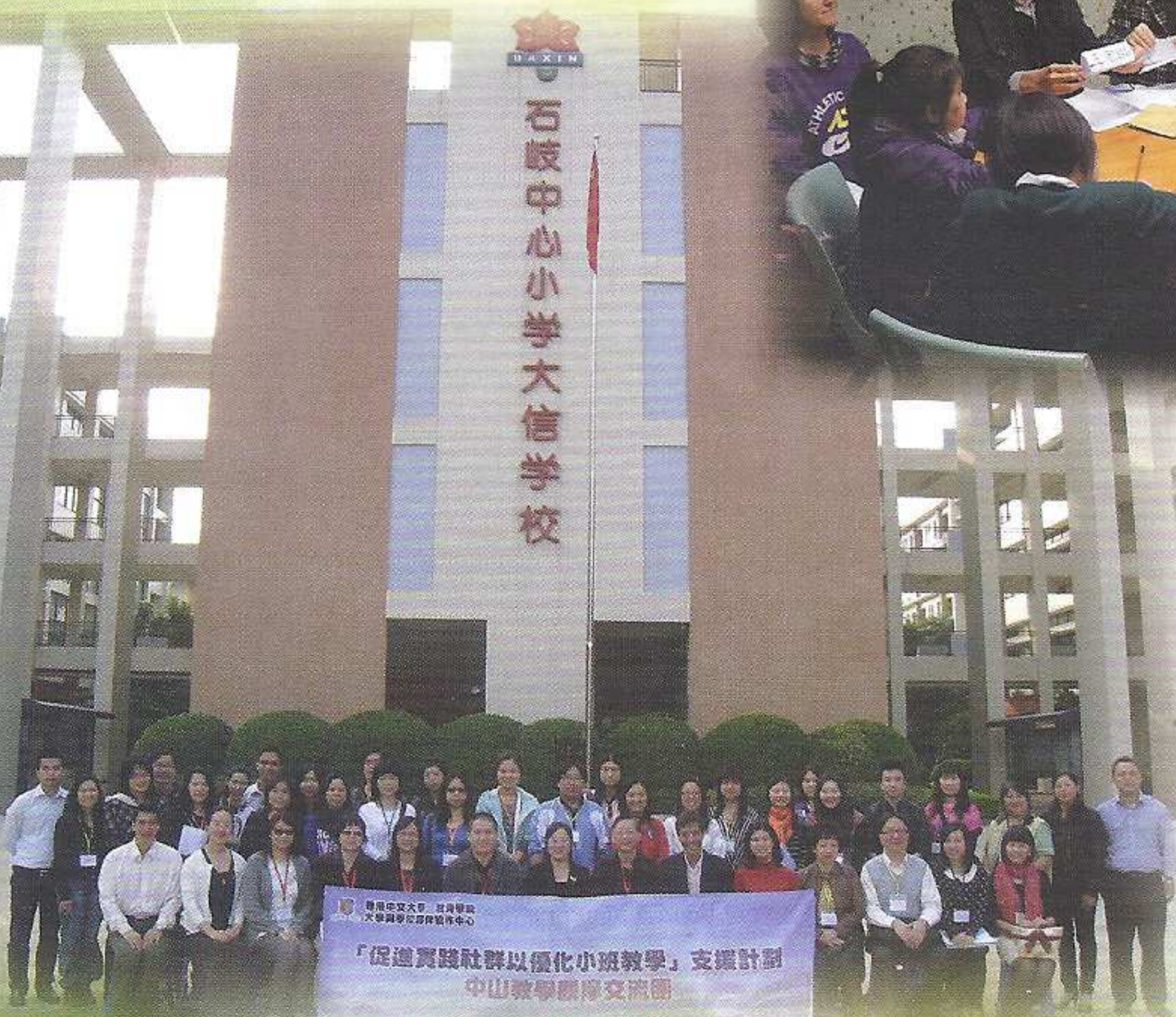
兩位數學科教師往中山交流