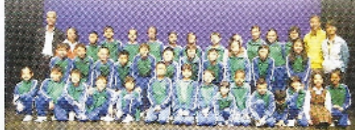
大家一同和花劍運動員合照。

香港2009東亞運動會將於12月5-13日舉行。為鼓勵同學積極參與及見證此國際盛事，本校於3月31日安排五年級同學參與「奧林匹克主義與2009年東亞運動會—研討會」。讓同學們藉此機會與本港精英運動員真情對話，交流比賽經驗和心得。