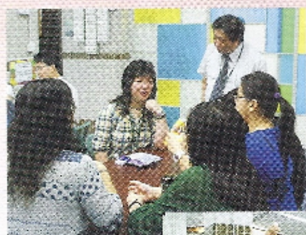
老師們一邊品嚐美味的薯片，一邊運用不同的形容詞來描述其味道！