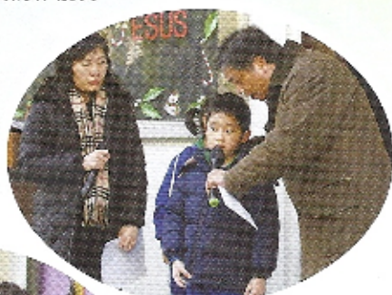
由校長和老師一起 講月訓，學生特別留心