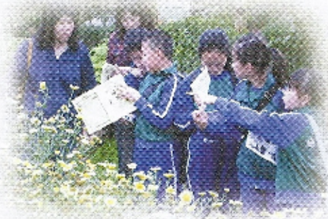
大自然是一趟學習的寶庫！