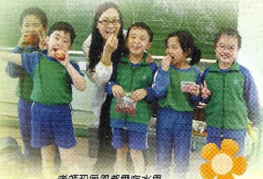
老師和同學都愛吃水果