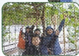
看！光明農場內的蘋果多翠靚