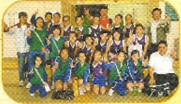
經過多番努力，終於取得冠軍