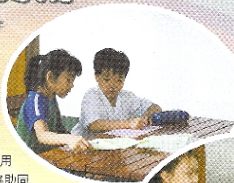
愛心大使悉心指導同學如何閱讀文章

綜觀受助同學、愛心大使及老師的評估問卷，大家也認同活動有助改善小二同學的謄字及寫作能力。