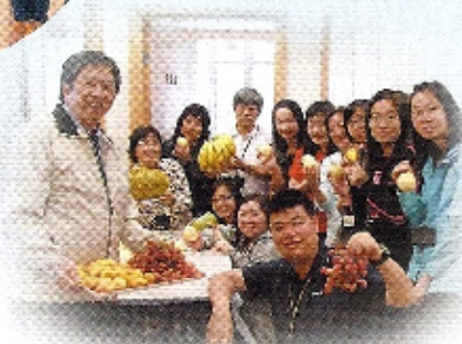
「430 水果日」，全校師生一同響應，一同進食有益健康的水果