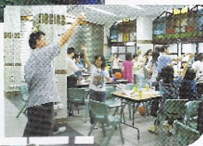
用紙做的竹蜻蜓，可行嗎？試試吧！