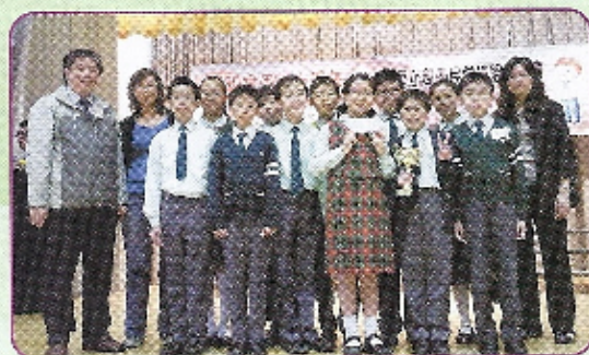
代表隊伍表現出色，奪得殿軍