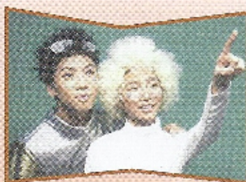
"Their clothes are really nice!" said one of our P.4 students.

They were eager to express their opinions and sent their comments back to the secondary school.