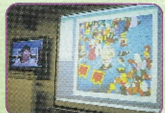
透過視像媒體的配合，香港的同學們都可一同運用內地的教材學習。