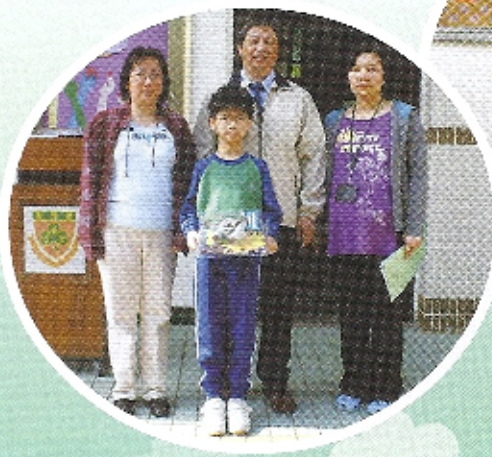
老師在每個月都會選出最有禮貌的學生，並頒發小禮物予以鼓勵

本年度訓輔組特設「我最欣賞的學生」和「最有禮貌學生」校本活動，目的是讓老師欣賞學生的成就，公開表揚有良好行為的學生，從而提升學生自信，成為其他同學的模範。而當中「最有禮貌學生」更是由高校長選派一位神秘老師，從日常校園活動中觀察一些對師長及同輩有禮貌的學生，並於早會公開表揚其良好的行為。每位被讚揚的學生可獲小禮物一份，並把學生及老師合照上載網頁。