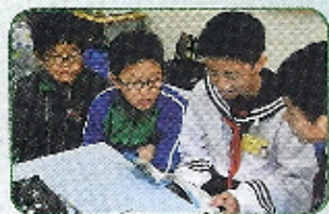
兩地的學生們 投入地閱讀文章