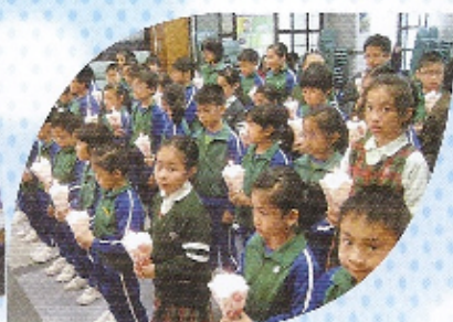
主啊！唯有藉著你的光明，以真誠的關懷，帶著愛的目光，與每個人交往