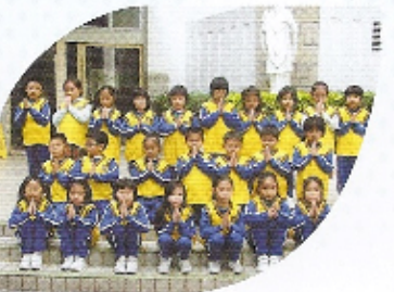
我們的基督小先鋒，最愛親近天父