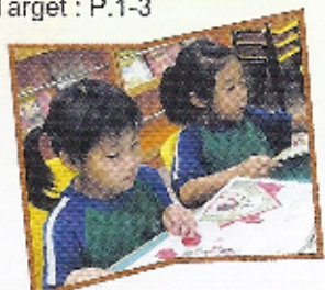
"Oh! I love this book!"