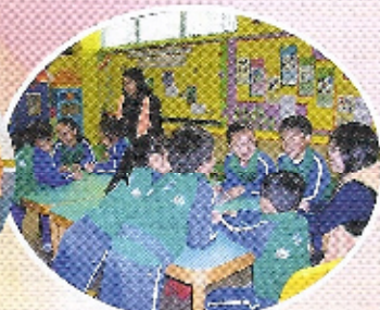
讀書會：閱讀不單是個人的事，也可以與同學一起分享。