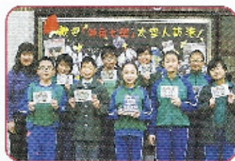
同學們參與後得到的明信片，十分有紀念價值。

為加強學生對國家航天事業的認識，從多角度思考航天科技的發展，本校特別安排9個六年級學生到香港灣仔伊利沙伯體育館，參與由教育局舉辦的「神舟七號載人航天飛行代表團與香港學生真情對話」活動，以提升他們對國民身份的認同。