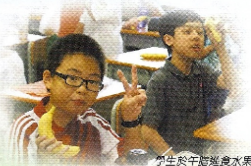
學生於午膳進食水果