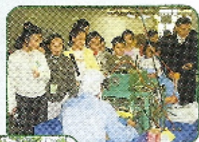
參觀友邦學校舞獅