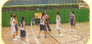
九龍北區學界籃球比賽女子組決賽比賽前照