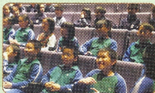
同學們專心地聆聽本港精英運動員的講解。