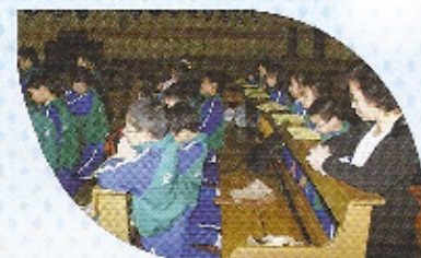
高衣聖多默宗徒堂朝聖