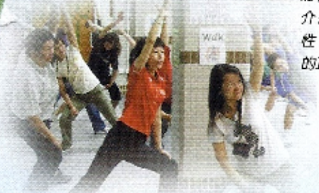
校長和老師們齊來做護脊操