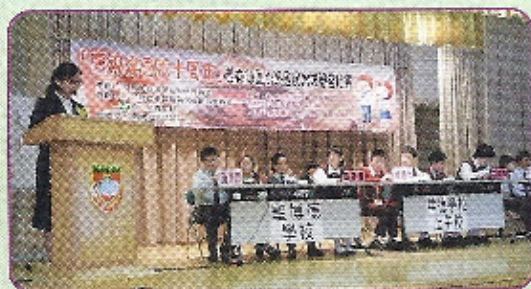
各位參賽精英全神貫注地聆聽問題，氣氛十分緊張

為增加學生對祖國的認識，本校挑選了11位學生，代表學校參加於2009年2月14日舉行的「慶祝建國六十周年」黃大仙小學國民常識問答比賽，並且獲得殿軍，表現真的出色。