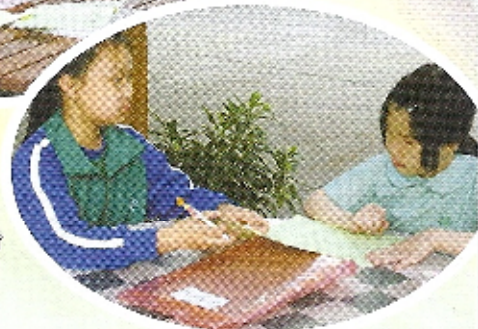
不用怕！有我指導你