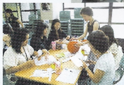
剪呀剪，貼呀貼！把藍球變成地球