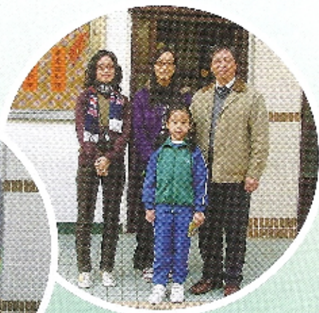
別看她小小年紀，其實是老師選出來的「最欣賞學生」