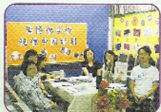
老師們正與內地老師進行教學研討。

本學年，本校繼續參加由聖文德書院舉辦的「普通話實驗課程」。舉辦該課程的目的是希望通過視像媒體進行遠程教學，加強學生普通話的能力。本校亦積極與國內教師進行教學交流，彼此分享教學心得。