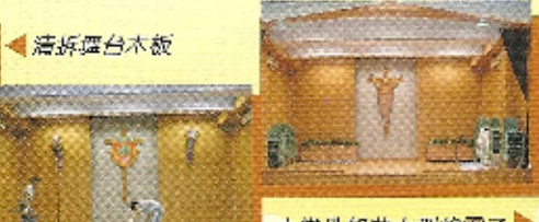
← 嶄新的舞台展現眼前