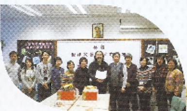
高校長及老師們恭賀倪神父晉鐸十七周年