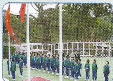
莊嚴的升旗儀式正式開始。