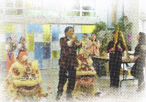
開幕儀式開始，大家喜氣洋洋

2009年為中華人民共和國建國六十年的日子，為加強學生的國民身份認同及連繫不同的學習領域，本校於4月25日舉行跨學科主題學習日，主題為「匯聚中華文化 弘揚博德精神」，藉此推動學生認識祖國文化及培養關心祖國的情懷。內容包括不同學科的學習成果展覽、棋位遊戲、中國傳統手工藝製作、中國民間遊戲、中國藝術及國粹欣賞、華服花生題、象棋比賽等，另設中國傳統美食坊，提供龍鬚糖、糖蔥餅、麥芽餅、糯米糍等供同學免費享用。