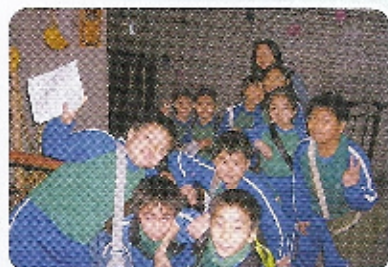
佈置逼真的舊香港出現眼前，連同學們也要在那裏拍攝留念呢！