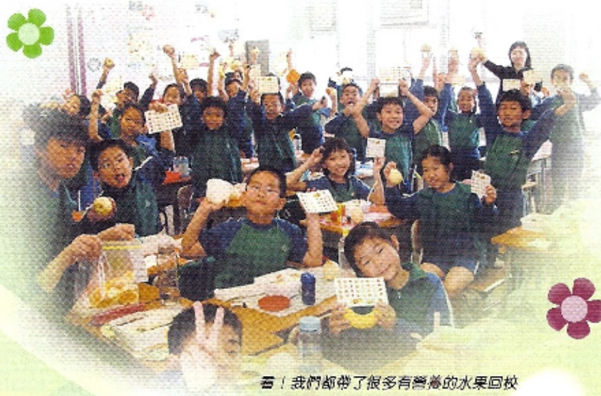
看！我們都帶了很多有營養的水果回校