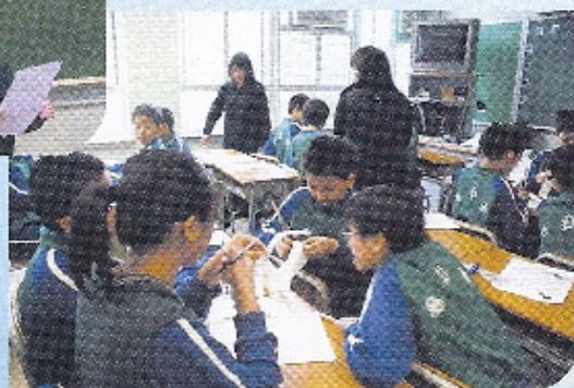
同學們在課堂上積極地進行小組討論