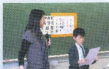
同學們都心聆聽同學的匯報，然後進行自評及互評