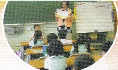
故事媽媽：故事媽媽於早讀課時，為低年級的同學講故事。