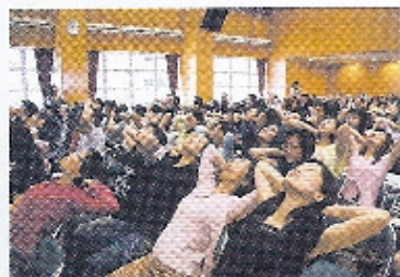
老師們也一同嘗試伸展運動！