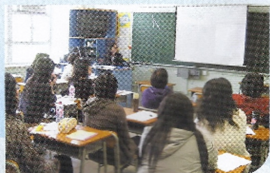
老師們進行教學分享，加強教師間的交流文化