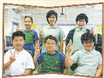
The TOP active participants in each level.