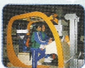
科學館內的展品新奇有趣，吸引學生圍觀和試玩。