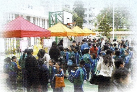
同學們踴躍參與嘉年華活動