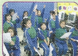
同學們踴躍地回答內地老師提出的問題，一起以普通話溝通和學習。