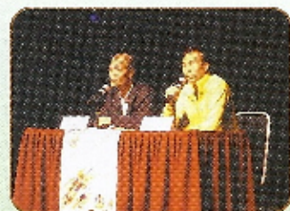
本港花劍運動員與學生真情對話，交流比賽經驗和心得。