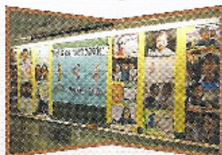
The Superkids organized activities for lower primary students.

The educators of Baptist University have been our lesson planning advisors for 3 years.