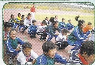
大家齊齊感，哈哈笑