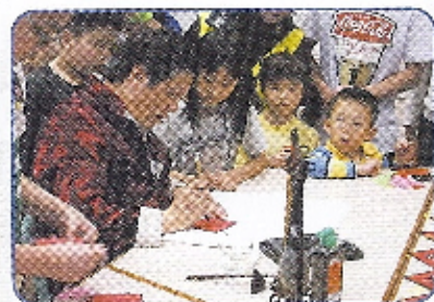
由校長示範的影沙之法吸引了不少學生圍觀