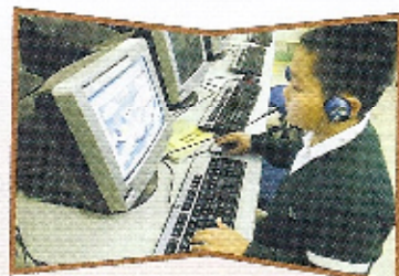
Students play and learn with WELNET during the lessons and recesses.