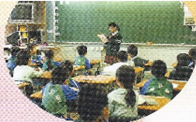
好書推介：同學於早讀課向全班同學推介好書，同學們都聽得津津有味。

本校於2008-09年度獲得「優質教育基金」資助，推行「閱讀伴我行」的閱讀計畫，藉此加強校園的閱讀文化，培養學生的自學能力，以及提升他們對閱讀的興趣，養成良好的閱讀習慣。是次計畫內容主要包括：家長閱讀講座、學生閱讀講座、閱讀護照計畫、好書推介、跨學科主題活動、故事媽媽及讀書會。