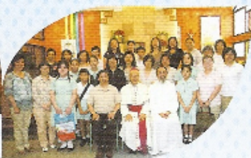
聖博德堂主保瞻禮感恩祭