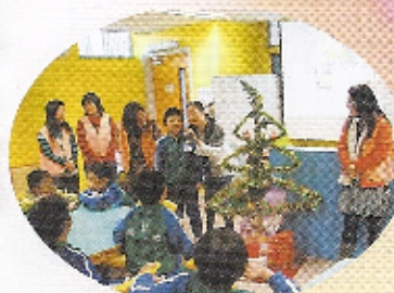
閱讀分享會：由家長及同學一起合作講故事，氣氛輕鬆、融洽，有助培養愉快閱讀的習慣。