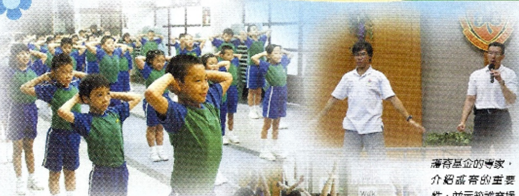
張百慶板，齊來護脊

本校今年推行健康校園計畫。主要分為健康飲食及護脊校園兩方面。在健康飲食方面：本校積極鼓勵學生培養進食水果的習慣，並以遊戲及活動方式加強推行健康飲食。在護脊校園方面：每隔一週的早會上，全校師生一起跳護脊操，並於小息時，全面推行課間護脊操計畫。