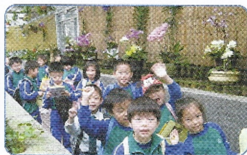
大家开开心心遊覽公園。